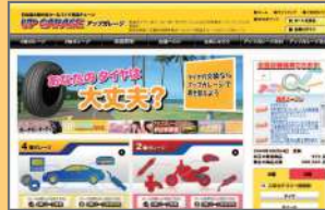
アップガレージ様